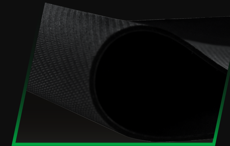
BASE DE GOMA